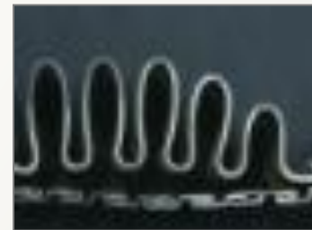
2중 Inner Bellows 압축 단면